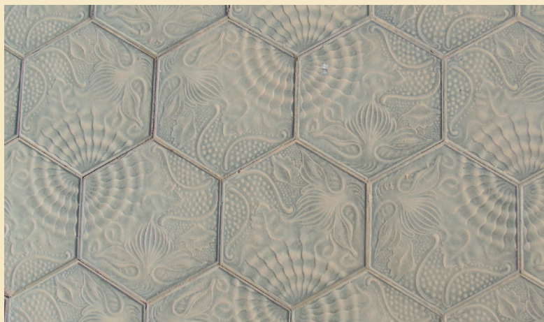
Aceras del Ayuntamiento de Daya Nueva.