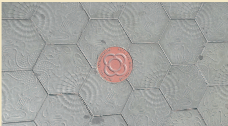
Aceras del Paseo de Gracia de Barcelona.