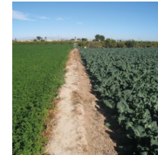
Vereda Alfalfa y Brócoli