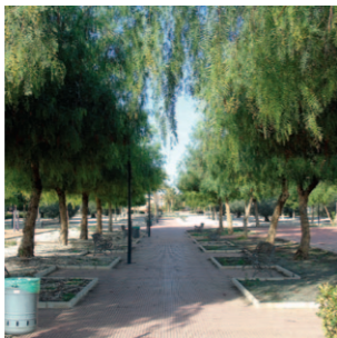
Parque Adolfo Suárez