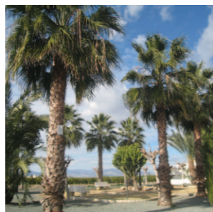
Parque C/ Francisco García Girona