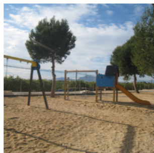
Parque Infantil C/ Francisco García Girona