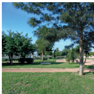
Parque María del Carmen Baeza