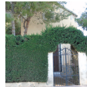
Ermita Virgen del Carmen Puebla de Rocamora