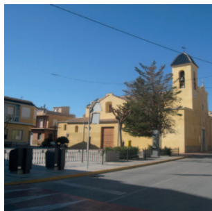
Plaza de José Antonio