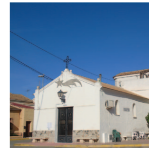
Ermita Nuestra Sra. del Rosario