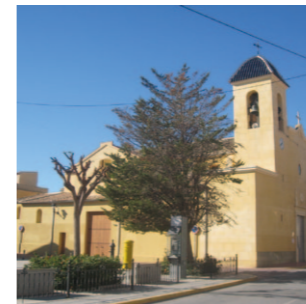
Iglesia parroquial San Miguel Arcángel