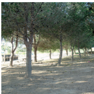
Zona Recreativa de la Puebla de Rocamora