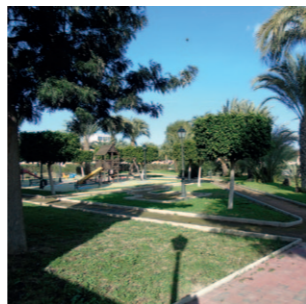
Parque de la Paz