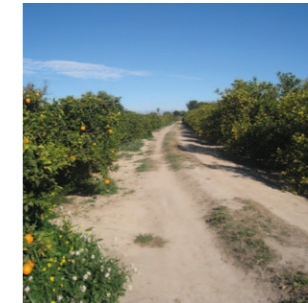
Vereda Naranjos y Limones